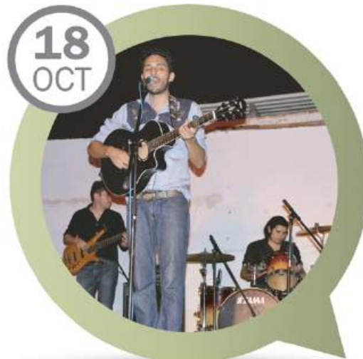
CONCIERTO "BORN GLOBAL" CASA DE LA CULTURA