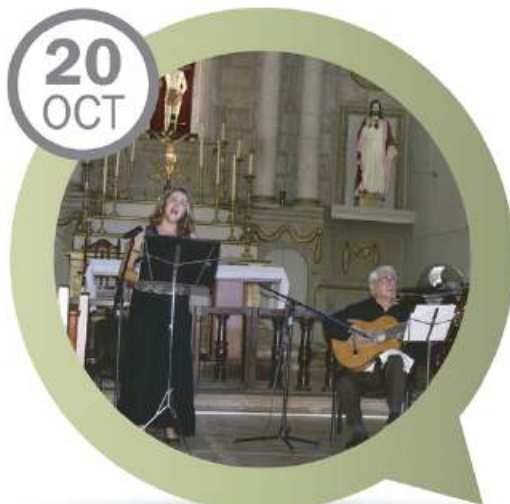
ENSAMBLE "LA ROSA ENFLORECE" PARROQUIA SAN SEBASTIÁN