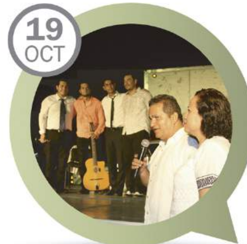
GRUPO "GADJO" PLAZUELA MORELOS