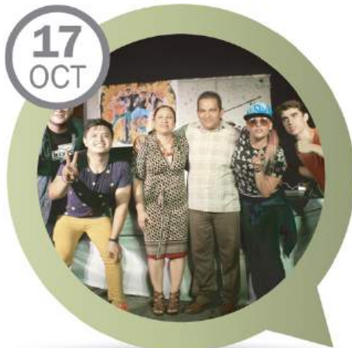
GRUPO DE ROCK "PISTACHE" PLAZUELA MORELOS